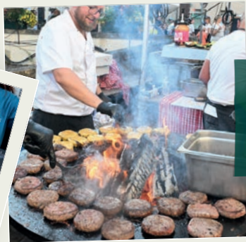
REPAS SUR PLACE